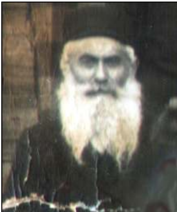
הרב אליהו דרימלער