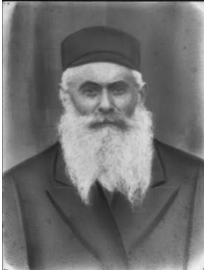
מראשי הקהילה וממייסדי "לחם עניים", בטומאשוב.